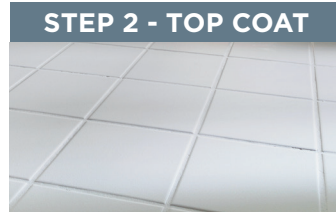
STEP 2 - TOP COAT