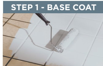
STEP 1 - BASE COAT