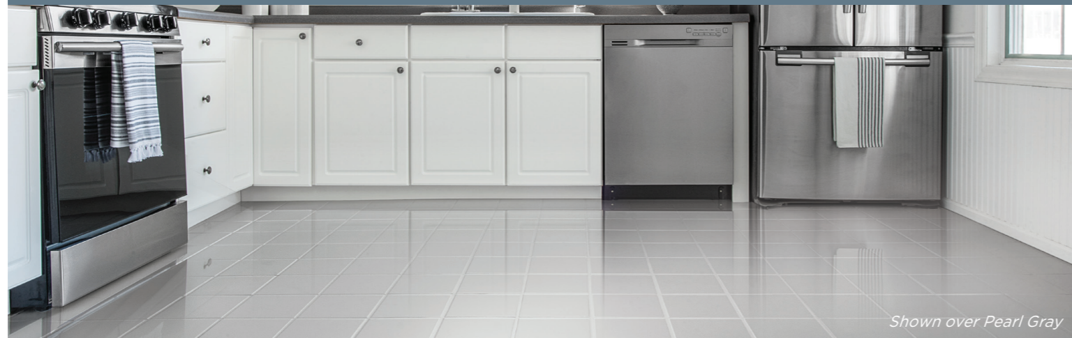
Shown over Pearl Gray

TRANSFORMS INTERIOR TILE, VINYL, WOOD & MORE